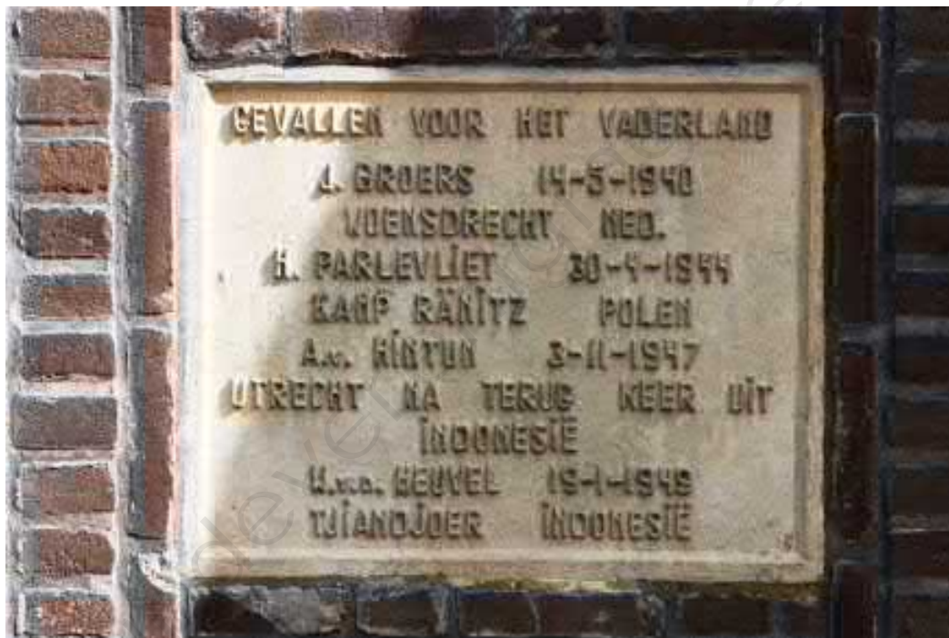
Afbeelding 5: Plaquette aan het (voormalige) gemeentehuis van Berghem a/d Burgemeester van Erpstraat.