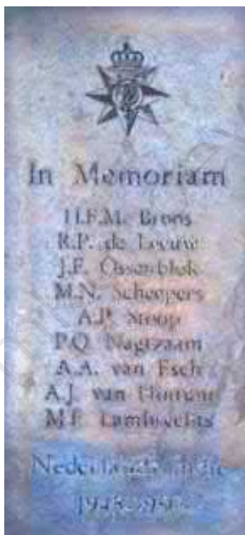
Afbeelding 2: Plaquette bij het bevrijdingsmonument ter gedachtenis aan de oorlogsslachtoffers van de 2 e wereldoorlog a/d Parklaan te Roosendaal.