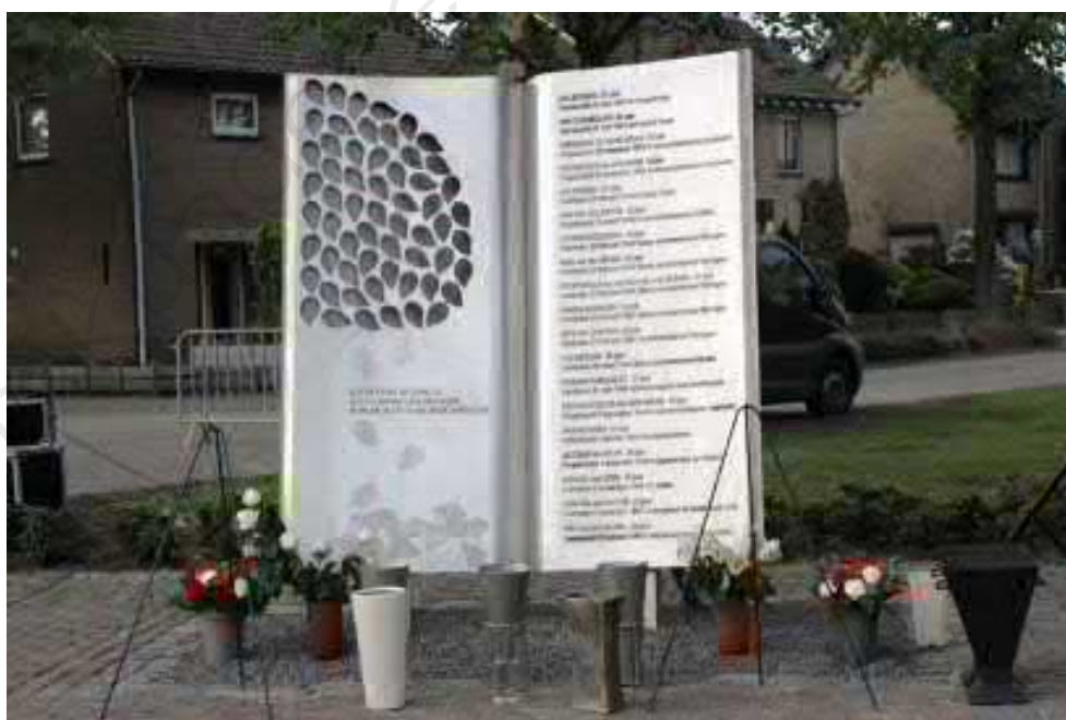
Afbeelding 7: Herdenkingsmonument Oorlogsslachtoffers Berghem te Berghem.

Bij dit herdenkingsmonument vindt vanaf 2015 de jaarlijkse 4-mei dodenherdenking plaats.