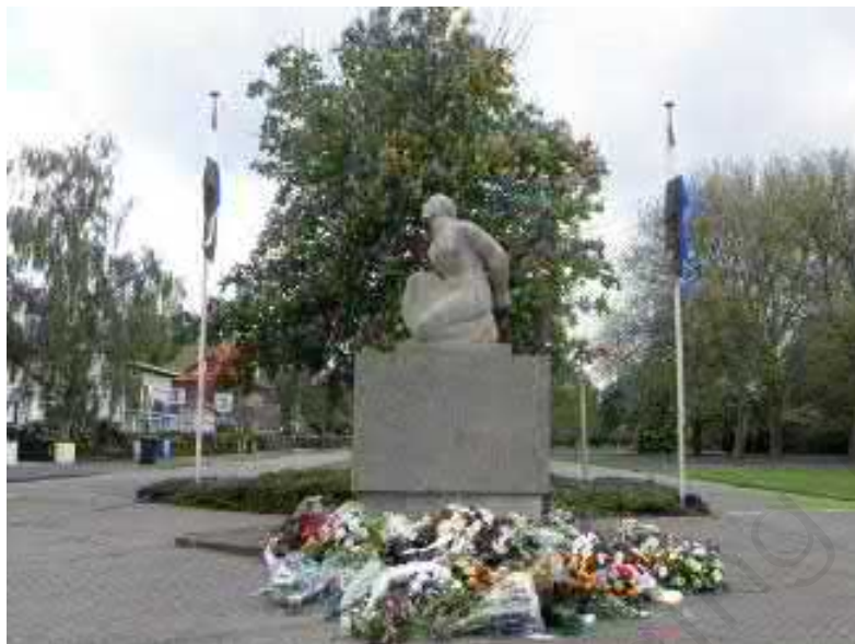
Afbeelding 1: Bevrijdingsmonument ter gedachtenis aan de oorlogsslachtoffers van de 2 e wereldoorlog a/d Parklaan te Roosendaal.

In de gemeente Roosendaal is aan de Parklaan een bevrijdingsmonument opgericht ter gedachtenis aan de oorlogsslachtoffers van de 2 e wereldoorlog (zie onderstaande ingevoegde afbeelding 1). Op dit monument is ook de naam van A.J. van Hintum opgenomen (zie onderstaande ingevoegde afbeelding 2), ten teken dat A.J. van Hintum in Roosendaal als oorlogsslachtoffer beschouwd wordt.